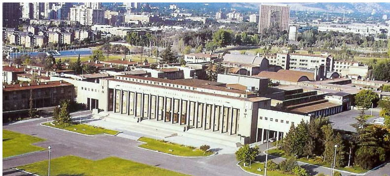
Liberator Bernardo O'Higgins Military School, Santiago

Na programu je kromě tradičního plenárního zasedání prezentace referátů a posterů v jednotlivých sekcích konference. Počítá se i se zasedáním komisí ICA, a to před 15. listopadem nebo po 20. listopadu. Součástí konference bude mezinárodní výstava map a výstava vítězných prací z národních soutěží o cenu Barbary Petchenikové. Připraveny budou rovněž technické exkurze na pracoviště, která se zabývají oblastí geoinformatiky. Součástí programu má být i setkání představitelů světových kartografických nakladatelství, představení tradičních chilských písní a tanců, exkurze po Santiagu a gala večer. Pro zájemce bude uspořádán i orientační běh v okolí města.